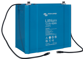
12,8V 60Ah LiFePO 4 accu