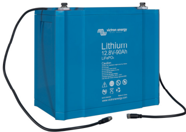
12,8V 90Ah LiFePO 4 accu

We hebben daarom twee 12,8 V accu's met geïntegreerde balancer-, temperatuur- en spanningsregelaar (Balancing, Temperature and Voltage control, BTV) ontworpen van respectievelijk 60 Ah en 90 Ah. Ons 12 V BMS ondersteunt tot 10 parallel geschakeld accu's (BTV's kunnen eenvoudig in een keten worden geschakeld), zodat een 12 V accubank tot 900 Ah kan worden samengesteld.