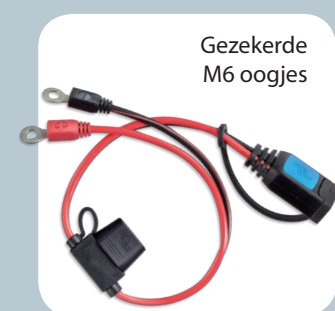
Gezeekerde M6 oogjes