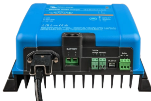
Phoenix Smart 12/50 (1 + 1)