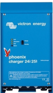
Phoenix charger 24V 25A

In ons boek 'Altijd Stroom' kunt U meer lezen over accu's en het laden van accu's (gratis verkrijgbaar bij Victron Energy en beschikbaar op www.victronenergy.com ). Voor de adaptieve laadkarakteristiek zie ook onder Technical Information op onze website.